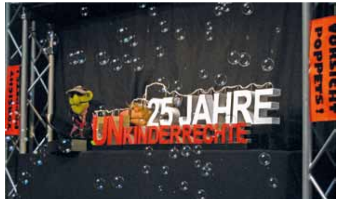
Abschlussveranstaltung des Jahres der Kinder- und Jugendrechte