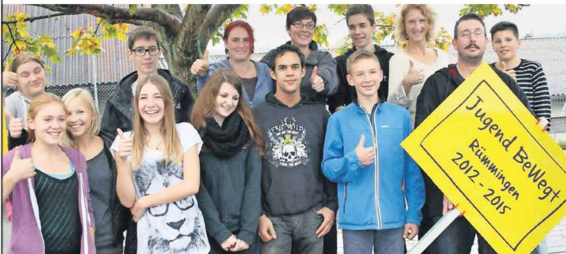
Die Gemeinde Rümplingen im Landkreis Lörrach hat das Projektziel von Jugend BeWegt erreicht: Die Jugend ist mit Begeisterung dabei. www...