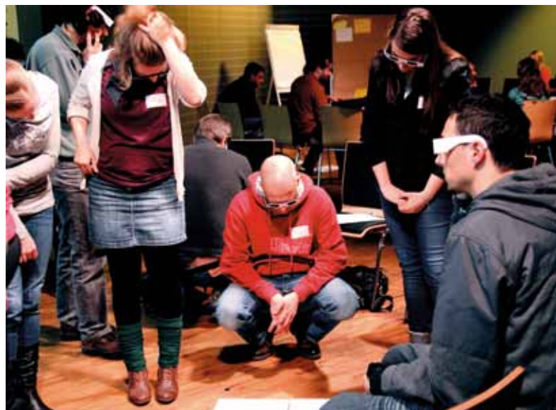
Gruppenarbeit: als kleine Herausforderung mussten sich die Teilnehmenden am Nachmittag in je eine Perspektive pro Gruppe hineindenken – und die Welt durch die blaue, rote, grüne oder gelbe Brille betrachten.

Mehr Infos: http://www.ljrbw.de/themen/tickets