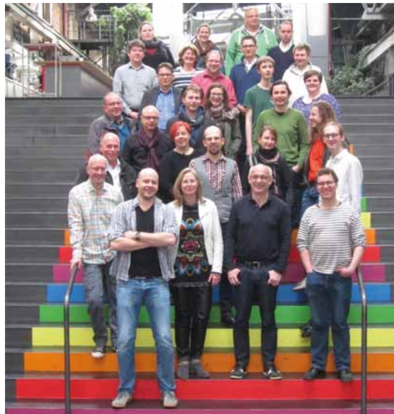
Die Vertreter*innen der Landesjugendringe bei der Konferenz am 09./10.03.2015 in Stuttgart.