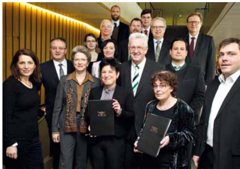
Im März 2013 unterzeichneten Vertreter*innen der Landesregierung, der acht Landesorganisationen der Kinder- und Jugendarbeit sowie der Jugendsozialarbeit und der Kommunalen Landesverbände den Zukunftsplan Jugend.

Eine Balance und ggf. eine Priorisierung zwischen den unterschiedlichen Themensetzungen von Berichtswesen über Partizipation und Schulkooperation bis hin zu Integration ist hochkomplex und schwierig. Alle Beteiligten sind in diesem Prozess Lernende und es mangelt dadurch immer wieder an Transparenz in der Ausgestaltung des Prozesses.