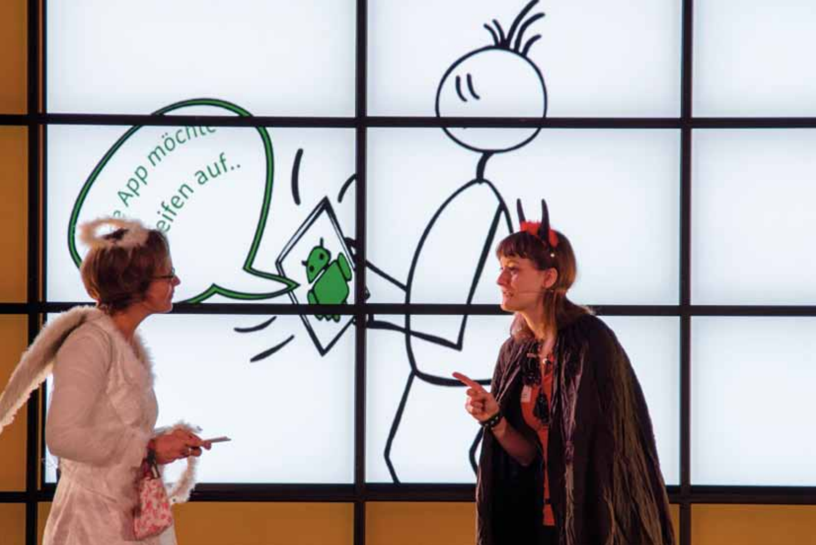
Kongress „Tickets ins Übermorgen“: Präsentation am Vormittag - aktuelle Trends