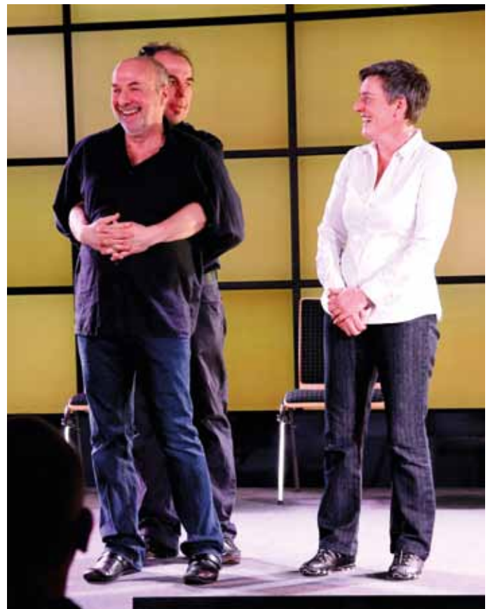
Szene aus dem Improvisationstheater am Nachmittag

Am 31.01. gab der Kongress „Tickets in Übermorgen“ des Landesjugendrings den Anstoß für Überlegungen, wie sich Jugendverbände und Jugendringe aufstellen müssen, um die Herausforderungen meistern zu können. In den Diskussionen traten vor allem folgende Themen in den Vordergrund: