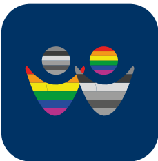
Gegen Benachteiligung aufgrund geschlechtlicher Identität oder sexueller Orientierung

Wir wenden uns gegen Antisemitismus in alten und neuen, religiösen, sozialen oder politischen Erscheinungsformen.