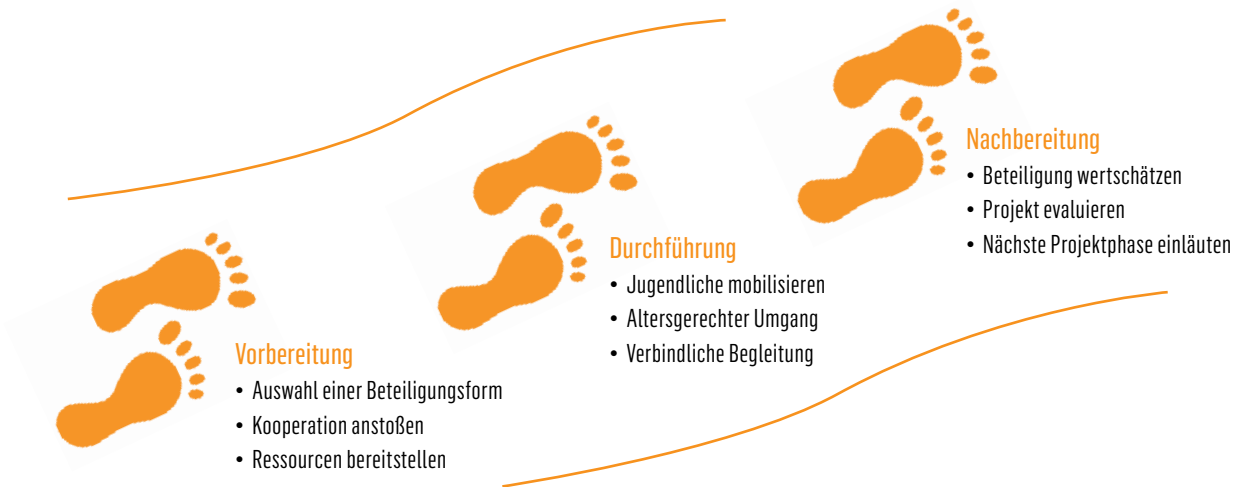
► Abb. 2: Die drei wesentlichen Schritte eines Jugendbeteiligungsprozesses